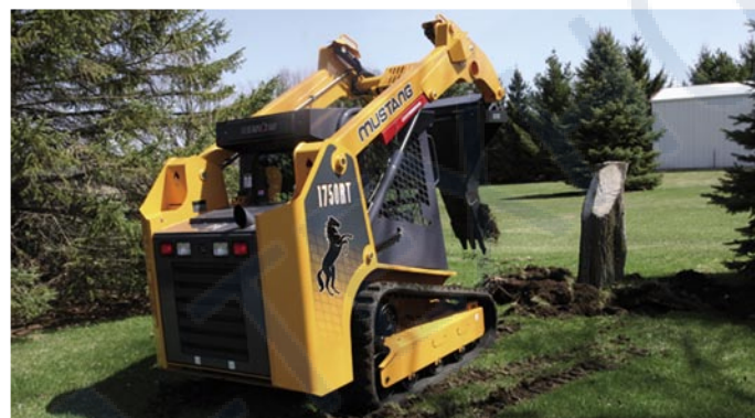
Гусеничный мини погрузчик MUSTANG 1750RT с выкорчевывателем пней