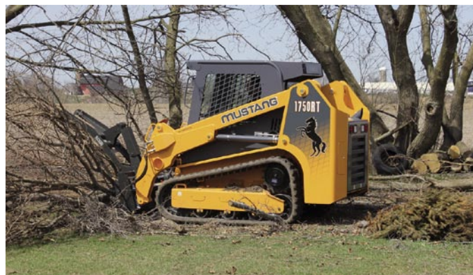
Гусеничный мини погрузчик MUSTANG 1750RT с гидравлическим захватом