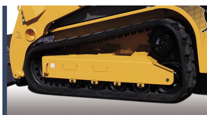
Положение гусениц при включенном двигателе